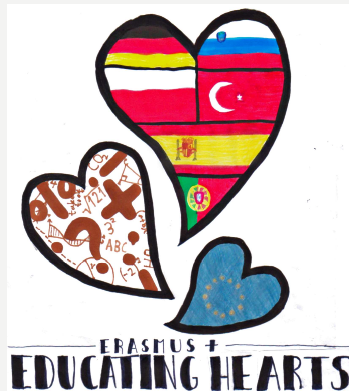
Primer logotipa za Erasmus + (Vid Laznik Šoštar)